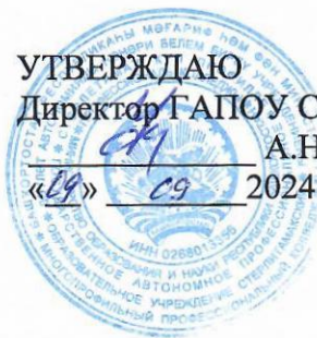
ГРАФИК ПРОМЕЖУТОЧНОЙ АТТЕСТАЦИИ

группы ПД-319 специальность 40.02.02 Правоохранительная деятельность